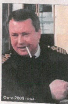
Фото 2005 года.

Россия в 2000-е годы «ставала с колен». Договор 2010 года о раз- граничении морских пространств и сотрудничестве в Баренцевом море и Северном Ледовитом океане пере- двинул границу Арктического сектора СССР в Северном Ледовитом океане на восток, отдав огромную территорию Баренцева моря с историческими закладами пограничничества «Штоман». Разведывательные исследования со- ветскими учеными восточной части «Федерации», находившейся в водах России, отнюдь Норвегии. Там был совершен обстрел, как показало