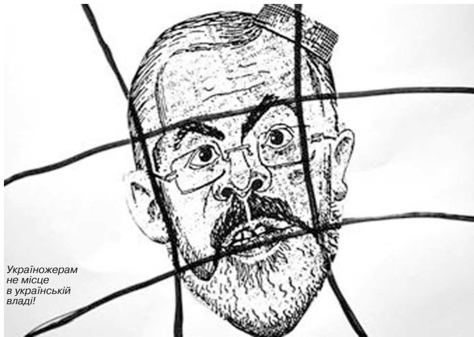
Україножером не місце в українській владі!

конуватимете усі забаганки сержанта Д.Табачника, будучи самі у званні генерала? Це я наводжу карикатуру журналу «Перець» 60-х років, коли генерал ФРН віддавав честь сержанту американської (окупаційної) влади в Німеччині.