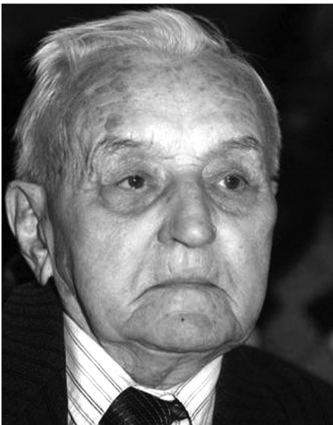
Василь Кук (псевдо – "Василь Коваль", "Юрко Леміш", "Медвідь") народився 11 січня 1913 р. у с.Красному Золочівсько-

Три роки тому, 9 вересня 2007 року, на 95-му році життя відійшов у вічність генерал-хорунжий УПА Василь КУК – останній Головнокомандувач Української Повстанської Армії (1950–1954 рр.).