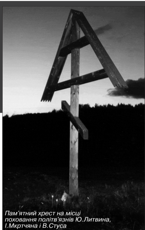
Пам'ятний хрест на місці поховання політв'язнів Ю. Литвина, І. Мкртчяна і В. Стуса

селення, непридатні для будівництва комунізму, кинуті на перетворення в табірний пил людиною влада більше не цікавилася, то в наш час винесений судом вирок не був остаточним. У наш час уже рідко хто потрапляв у політичні табори "ні за що". Це були активні люди, які, звільнившись, могли повстати знову. Тому влада пильно стежила за кожним, визначала значущість особи, її потенційні можливості – і відповідно до неї ставилася. Це була свого роду експертиза: вивчали тенденцію розвитку (чи загрози) тієї чи тієї особистості і вживали превентивних заходів, щоб з неї не виростало більшої для держави небезпеки. З цього погляду Василь Стус справді становив особливу небезпеку для існуючого ладу. Він, разом з іншими дисидентами, справді підірвав владу комуністів. І вона таки впала – вичерпавши свої економічні можливості, не витримавши військового протистояння з Заходом, зазнавши ідеологічного краху. Ми боролися на цьому фронті – ідеологічному. І перемогли.