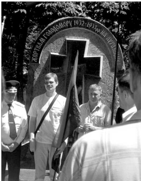
Під час мітингу-реквієму в Луганську

Текст підготував Богдан ЗАХАРЯК, "Нація і держава". Світлина автора