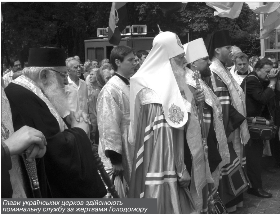
Глави українських церков здійснюють поминальну службу за жертвами Голодомору