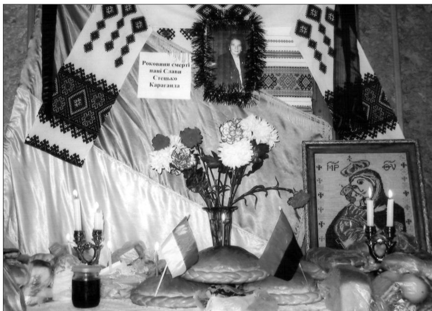
У світлиці української громади Караганди – вшанування пам'яті Слави Стецько.