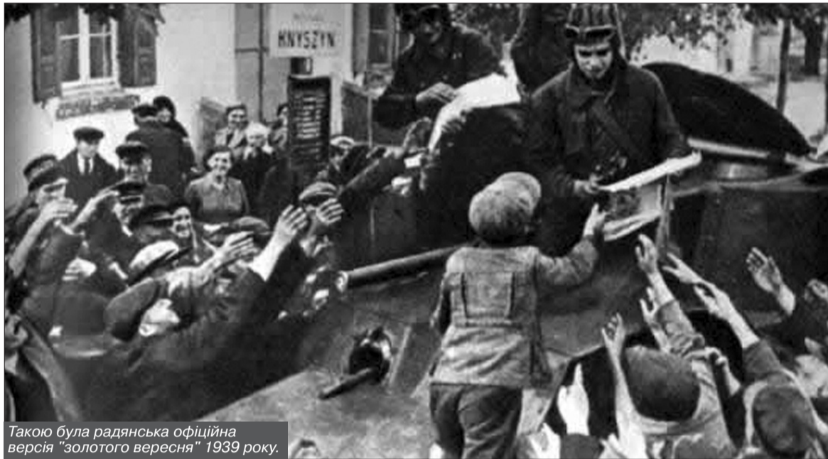
Такою була радянська офіційна версія "золотого вересня" 1939 року.

– Указ від 26 травня 1947 року "О восстановлении в гражданстве СССР подданных бывшей Российской империи, а также лиц, утративших советское гражданство, проживающих на территории Бельгии" (Див. Сборник законов СССР и Указов Президиума Верховного Совета СССР (1938 – июль 1956 гг.). Государственное издательство юридической литературы. Москва-1956. стор. 71)