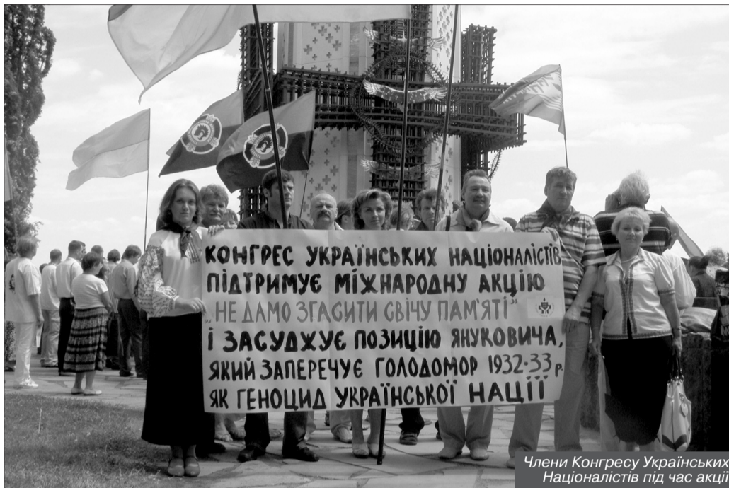
Члени Конгресу Українських Націоналістів під час акції

За словами І.Юхновського, у розпал голоду, зокрема влітку 1933 року, тільки за один місяць – червень, в Україні голодною смертю померло 1 млн. 200 тис. чоловік. Він також відзначив, що загальні втрати України, з огляду на тих, хто не народився, становлять близько 10 млн. чоловік.