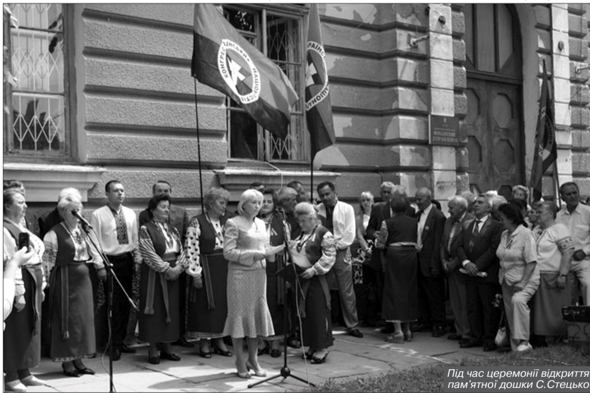
Під час церемонії відкриття пам'ятної дошки С. Стецько

Вона вірила в силу і велич українського народу, любила Україну, як люблять Бога", – зазначив С. Брацюнь. Він також передав вітання учасникам заходу від Головного Проводу партії і особисто від Голови Конгресу Укра-