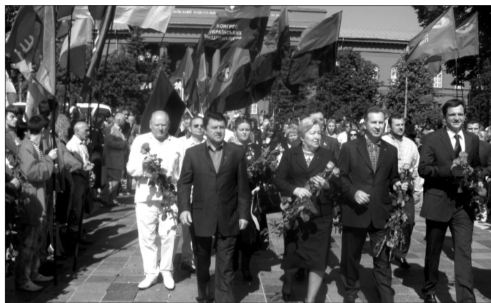
Під час покладання квітів до пам'ятника Тарасові Шевченку в Києві