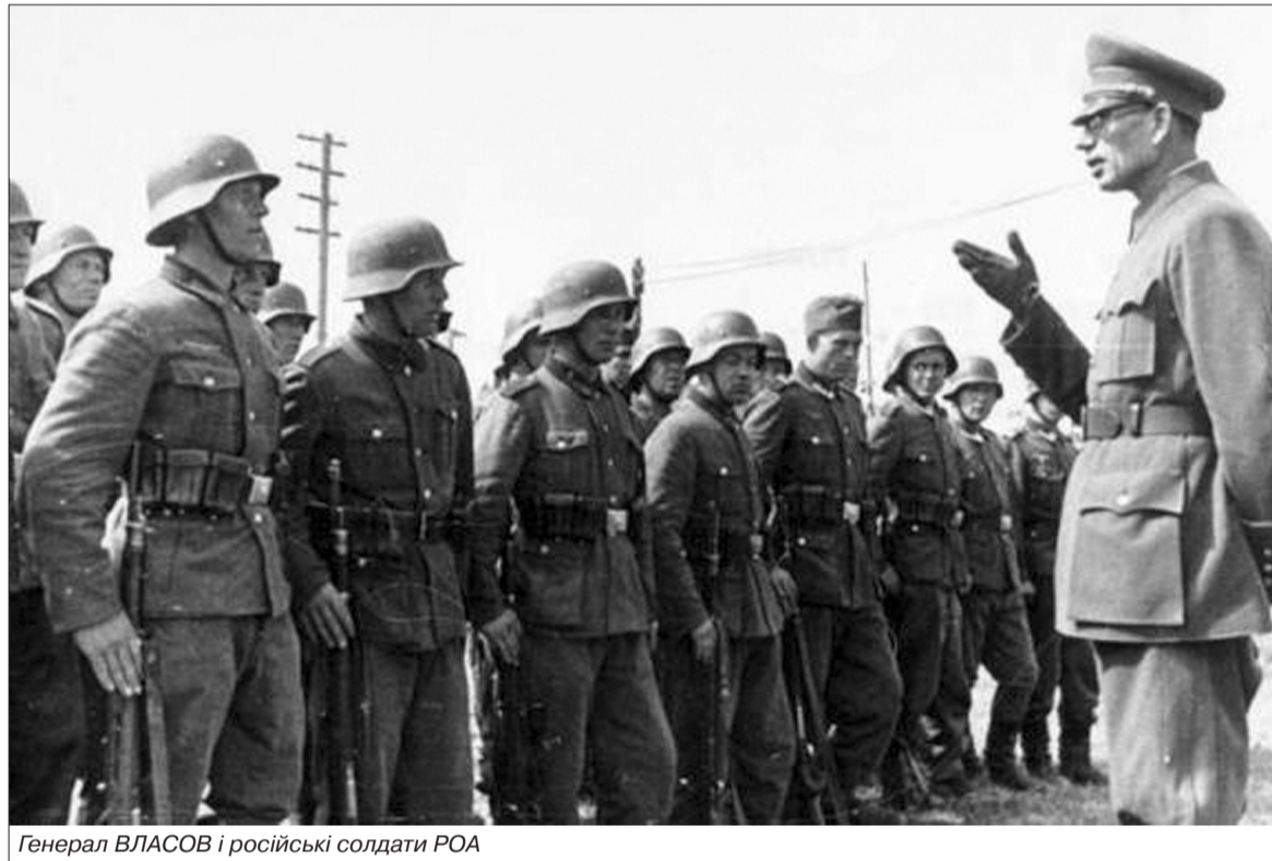
Генерал ВЛАСОВ і російські солдати РОА

Пізніше, 28 липня 1942 р., Сталін указом №227 ("Ни шагу назад") узаконив розстріл за найменший відступ. І нарешті були створені заградзагони НКВД, які гнали бійців в атаку. Лютував СМЕРШ. Отож сотні тисяч радянських вояків загинуло через бездарність багатьох генералів, які, крім кавалерійських атак, більше нічого не вміли, а радянсько-німецька війна, як і Друга світова війна в цілому, була