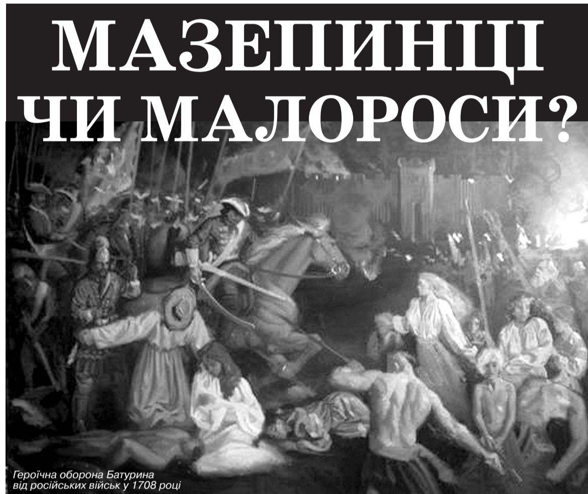
Героїчна оборона Батурина від російських військ у 1708 році

ковського публіциста, як і його намагання видати відновлення історичної пам'яті українців за безглузді пошуки, як він вважає, сумнівних фундаторів української державності. Серед останніх найбільше претензій висуваюто Іванові Мазепі. І хіба це не свідчення того, що носії імперської свідомості і нині бачать в українському гетьмані постать діючу і небезпечну для себе?