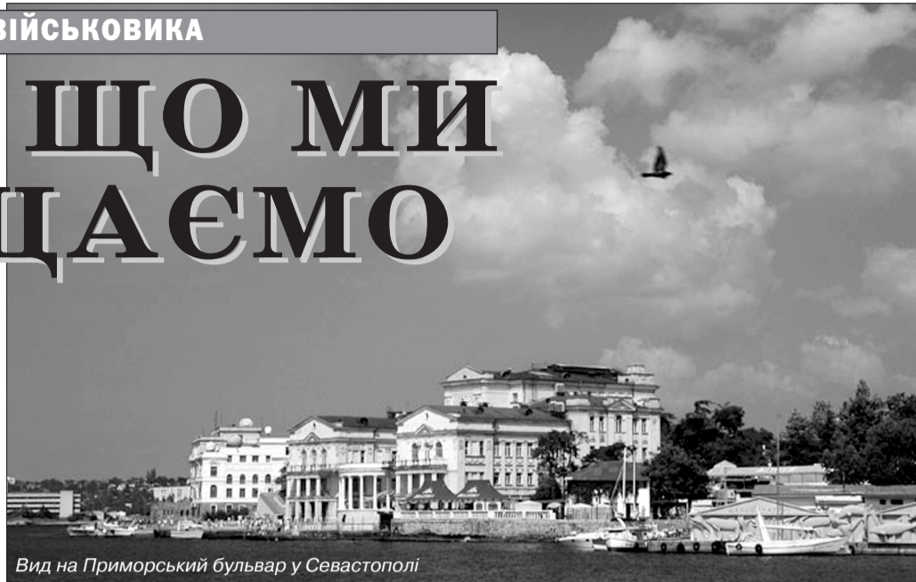
Вид на Приморський бульвар у Севастополі

За живою бесідою про конституційний обов'язок захищати Вітчизну непомітно порівняли з Приморським бульваром. Над ним зухвало, з викликом височить "Дом Москви", а поруч – берегові об'єкти російського Чорноморського флоту. Далі постали виробничі корпуси та берегові підйомні крани колишнього "Севастопольського морського заводу". Його прихватував олігарх, колишній міністр закордонних