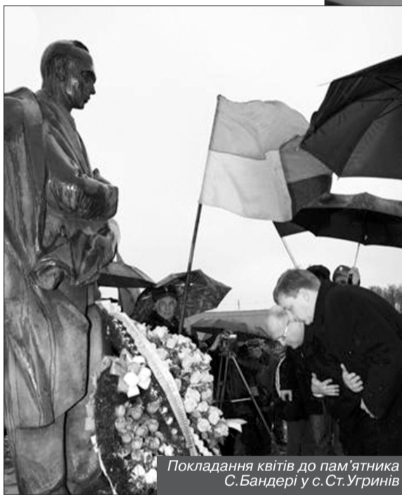
Покладання квітів до пам'ятника С.Бандері у с.Ст.Угринів

Уже за традицією в Івано-Франківську захід розпочався з урочистої ходи від Вічевого майдану, у якій взяли участь