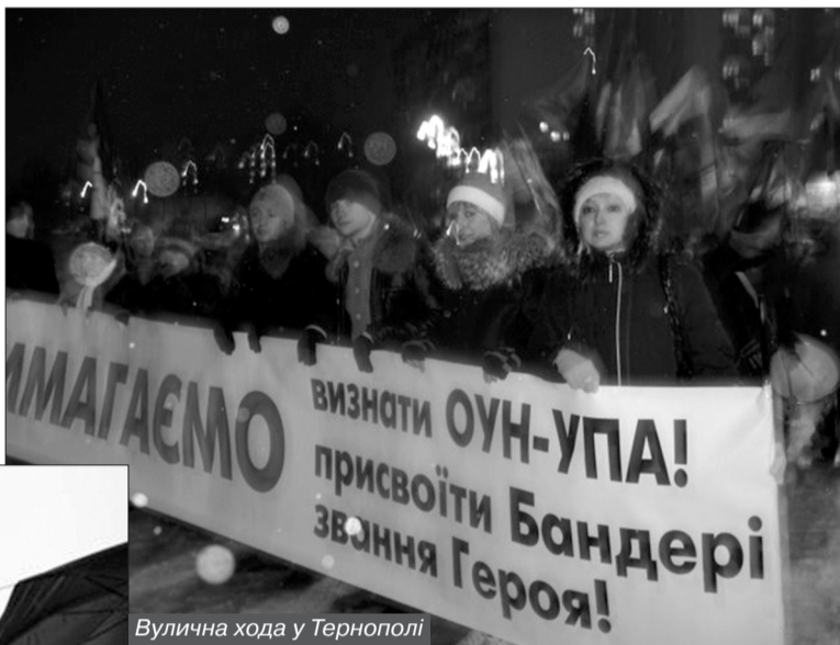
Вулична хода у Тернополі