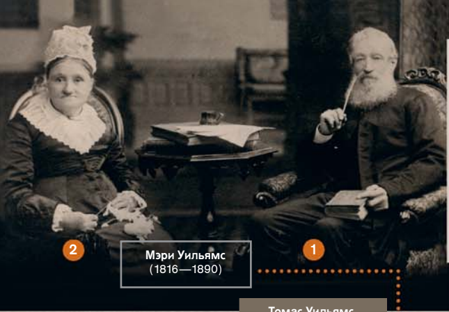
Мэри Уильямс (1816—1890)