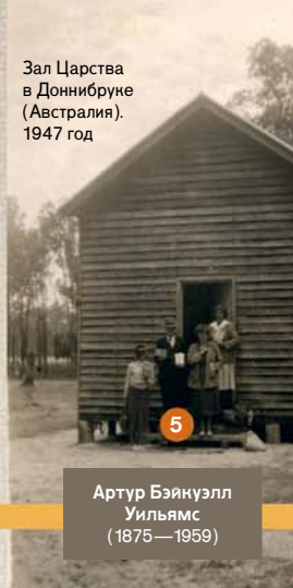
Зал Царства в Доннибруке (Австралия). 1947 год