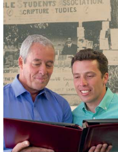
Знакомлюсь с историей нашей семьи (вместе с отцом)

Люди говорят, что я — вылитый отец. Та же походка, взгляд, чувство юмора. Но отец также передал мне нечто более ценное — наследие семи поколений нашей семьи. Именно об этом и будет мой рассказ.