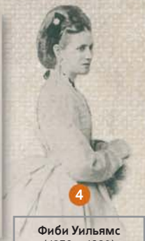
Фиби Уильямс (1850—1926)