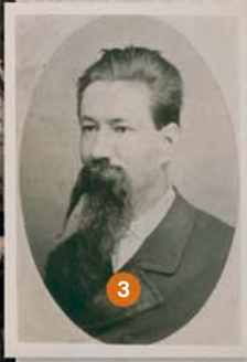
Томас Уиттон Уильямс (1841—1902)